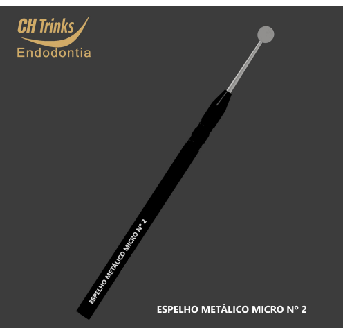
ESPELHO METÁLICO MICRO N° 2