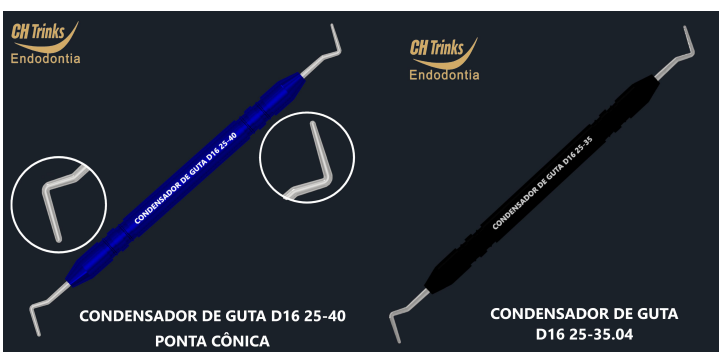
CONDENSADOR DE GUTA D16 25-40 PONTA CÔNICA