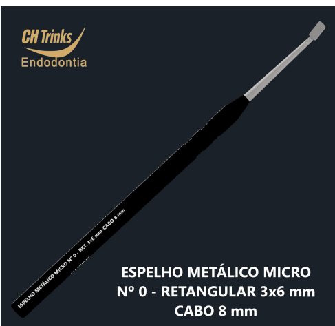
ESPELHO METÁLICO MICRO N° 0 - RETANGULAR 3x6 mm CABO 8 mm