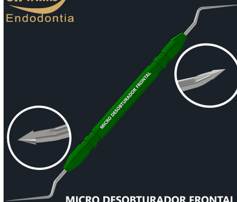
MICRO DESOBTURADOR FRONTAL