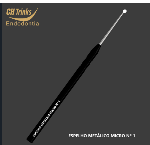
ESPELHO METÁLICO MICRO N° 1