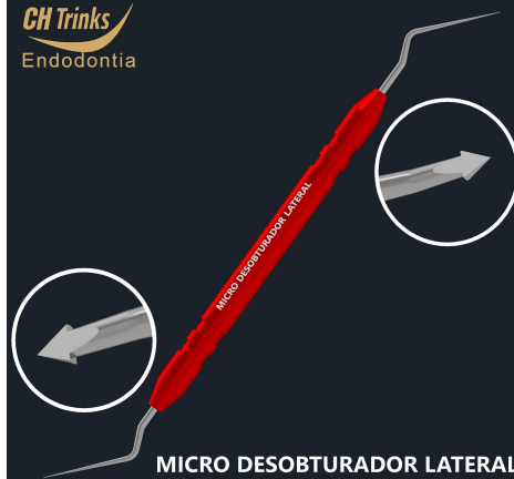
MICRO DESOBTURADOR LATERAL